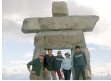
バンクーバーは2010年の冬季オリンピックのホストシティ！

ただ、英語とアクティビティーを組み合わせているプログラムではなく、2007年度からは、それぞれ